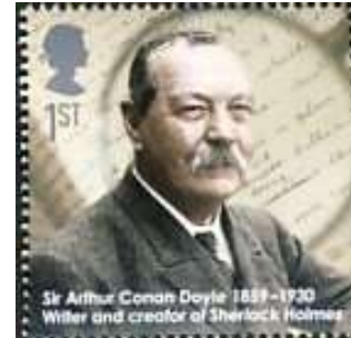
Timbre de 2009 Yvert N° 3195

Arthur Conan Doyle (né Arthur Ignatius Conan Doyle le 22 mai 1859 à Édimbourg, en Écosse, et mort le 7 juillet 1930 à Crowborough dans le Sussex), est un écrivain et médecin britannique. Il doit sa célébrité à ses romans et nouvelles mettant en scène le détective Sherlock Holmes. Joueur de rugby